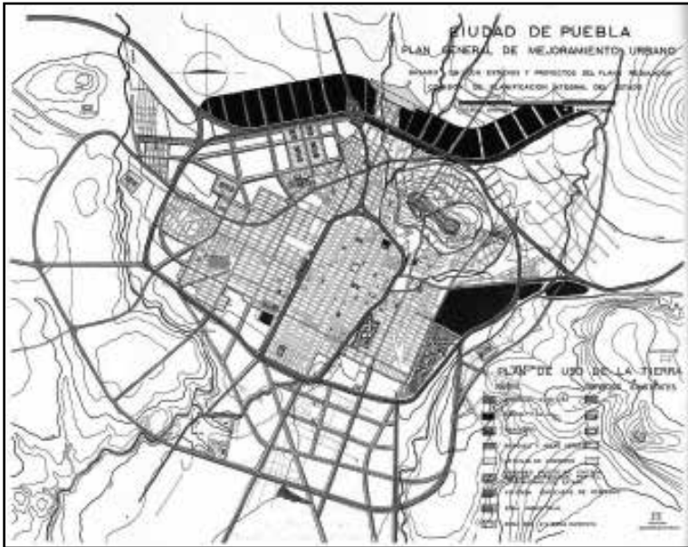
Imagen 5 PLAN GENERAL DE MEJORAMIENTO URBANO DE LA CIUDAD DE PUEBLA, 1959