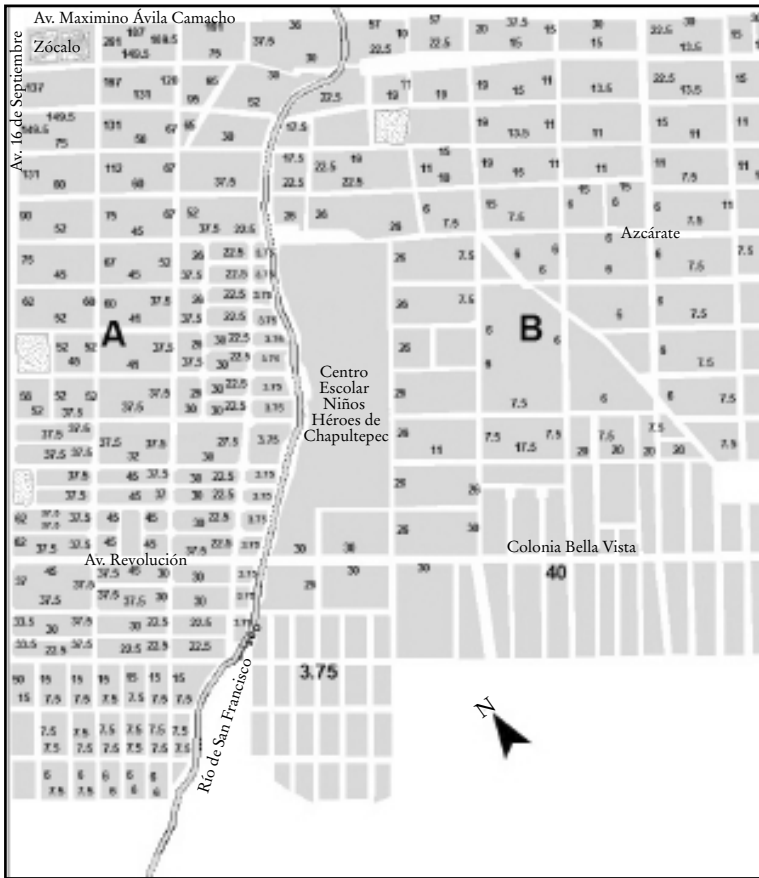
Imagen 3 CUADRANTE IV DE LA CIUDAD DE PUEBLA, VALORES CATASTRALES POR METRO CUADRADO, 1960

FUENTE: AGEP, Periódico Oficial del Estado de Puebla (17 jun. 1960). Adaptado de la Tabla de Valores Catastrales de 1960, OLIVEIRA, "De las avenidas".