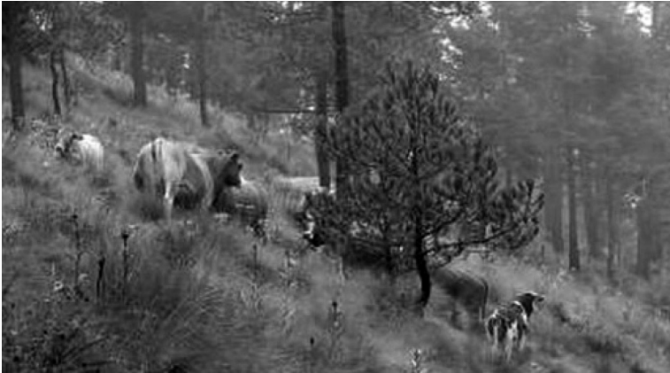
Foto 2 GANADO EN LOS MONTES DE CONTRERAS