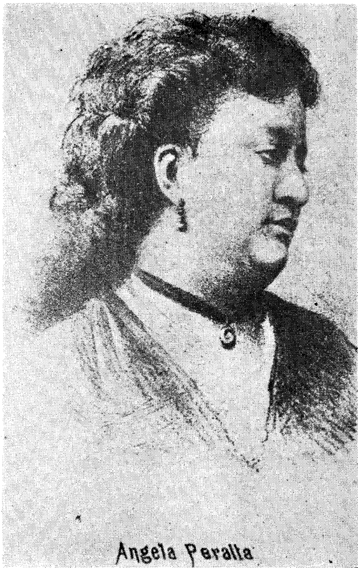
La soprano Ángela Peralta.