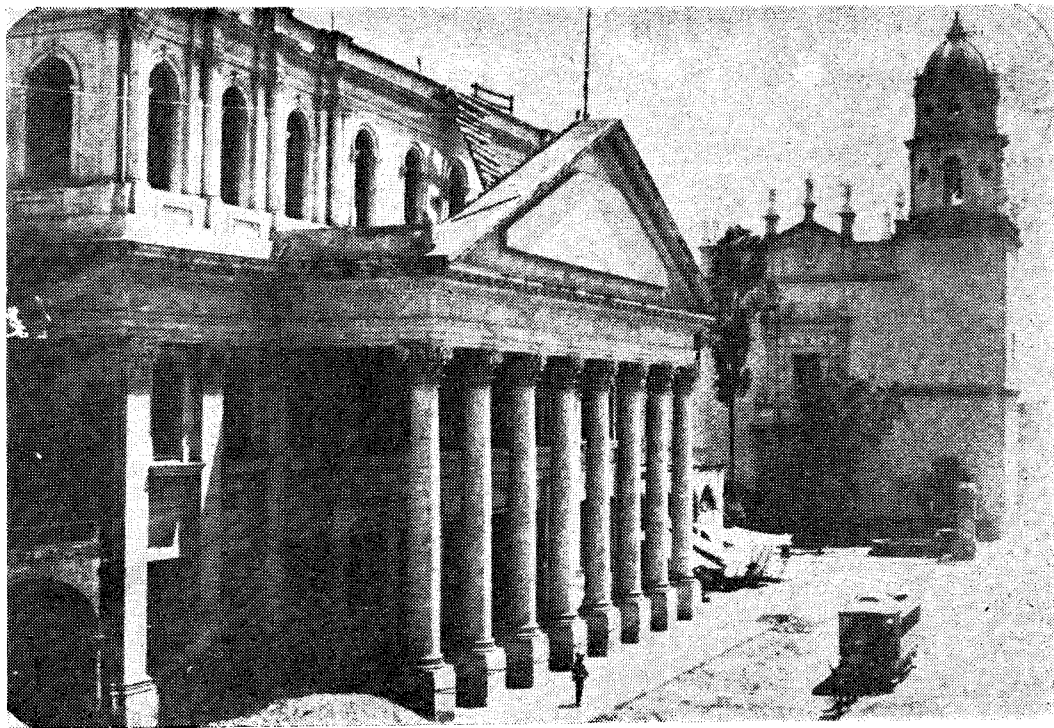
El Teatro Degollado y la iglesia de San Agustín en 1880.