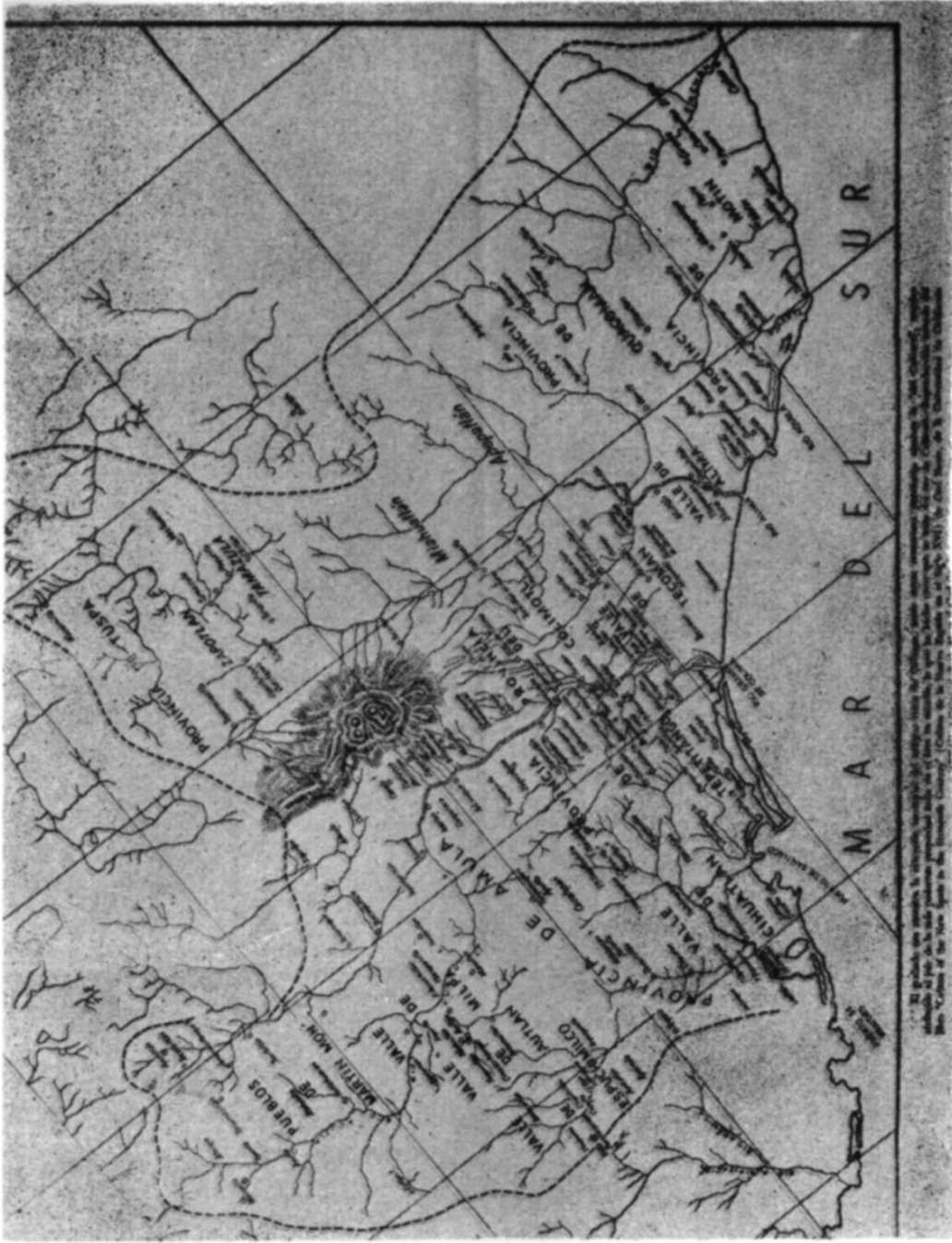
Mapa de la región de Colima (1553), época de la visita del Lic. Lebrón de Quiñones. Se aprecia la ubicación exacta de la Navidad. (Tomado del libro "El Rey de Coliman").