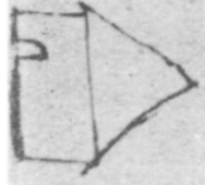
"Relación" o "Descripción" de Ameca, del alcalde mayor Antonio de Leyva, escrita en 1579. Reproducida del libro de J. Amaya Topete, "Ameca, protofundación mexicana."

Venida en un muelle. y aya. Para esta en la caña no se de esta en una de re que pasan en esta en en la parte de la mu da ya sea re yo son grandes ni de las son en en en en en en en en en en en en en en en en en en en en en en en en en en en en en en en en en en en en en en en en en en en en en en en en en en en en en en en en en en en en